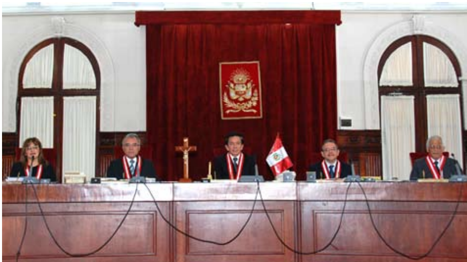
Integrantes de la Sala de Derecho Constitucional Permanente que resolvieron primera casación aplicando la Ley Procesal del Trabajo.