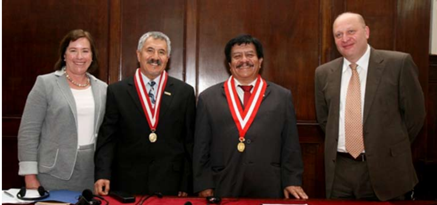
Expertos canadienses acompañados por los Jueces Supremos Ramiro de Valdivia y Vicente Walde.