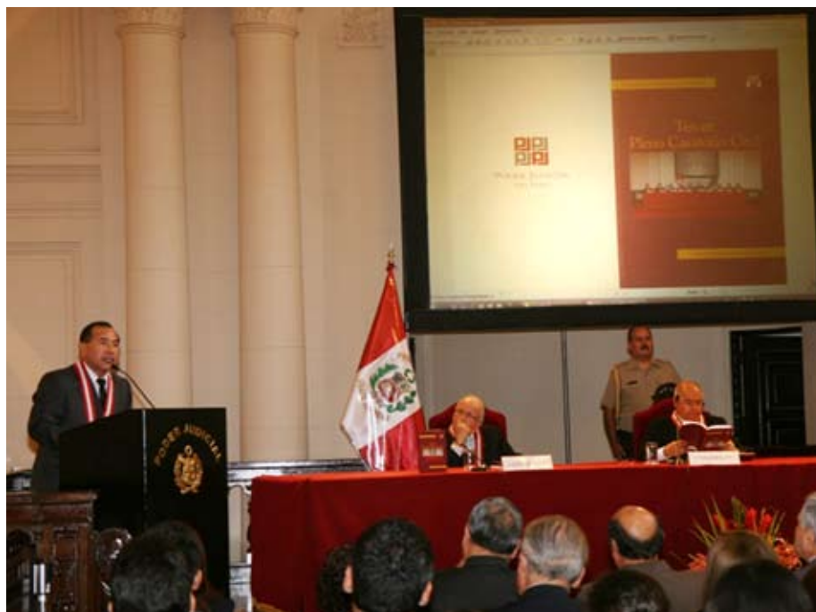
Juez Supremo Víctor Ticona explicó lo resuelto en Tercer Pleno Casatorio Civil.

“El eje debe ser siempre el respeto a la familia como núcleo fundamental de la sociedad, cuidarla mucho porque ahí también se juega el destino del país