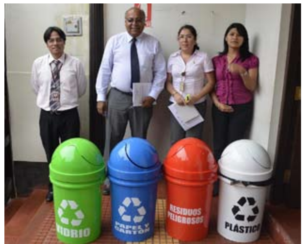
Tachos de almacenamiento de diversos colores.