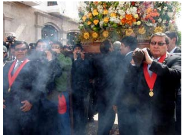
Jueces y trabajadores de Puno rindieron homenaje a Virgen de la Candelaria.

La Corte Superior de Puno rindió homenaje a la Virgen de la Candelaria al paso de su recorrido procesional por el Palacio de Justicia. La sagrada imagen recibió ofrendas, oraciones y una especial alfombra de flores con el nuevo logo institucional. Participaron activamente magistrados y trabajadores del Distrito Judicial.