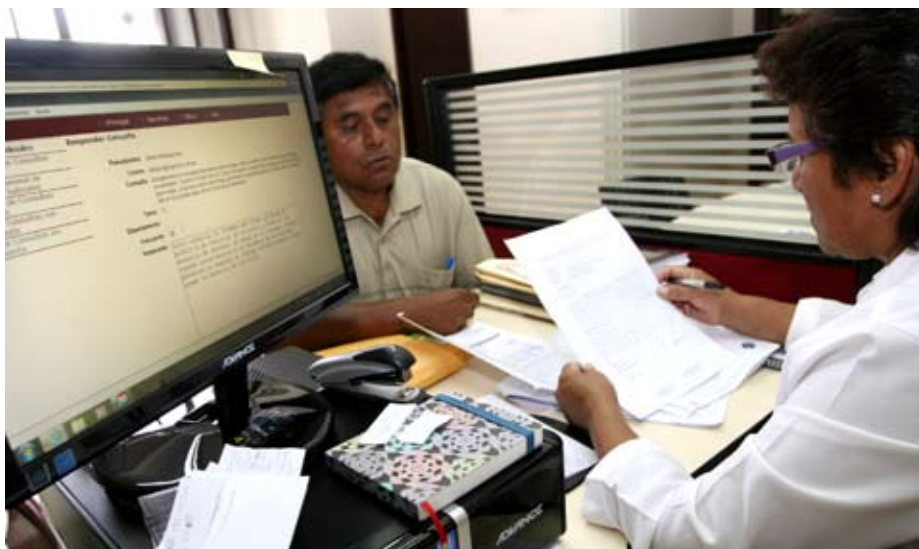
OOGU está ubicada en el primer piso de palacio de justicia.