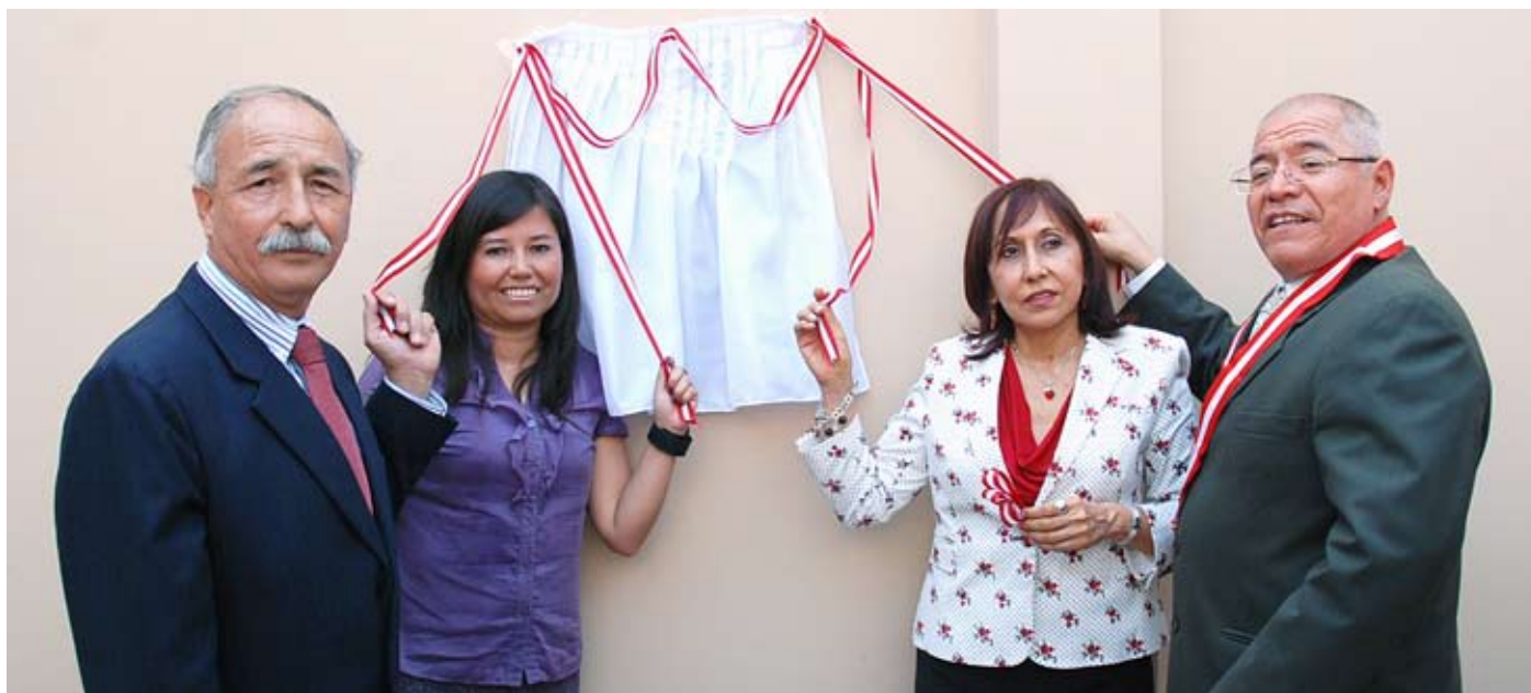
Se inauguró tres aulas escolares, una sala de terapia y una sala de asesoría legal.

● Establecimiento cuenta ahora con tres aulas escolares, salas de terapia y asesoría legal, y guardería infantil.