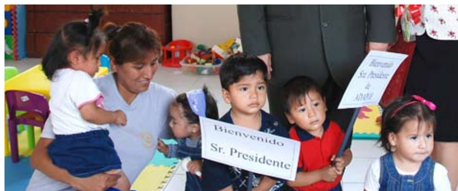
Hijos de las adolescentes infractoras del Centro Juvenil “Santa Margarita”.