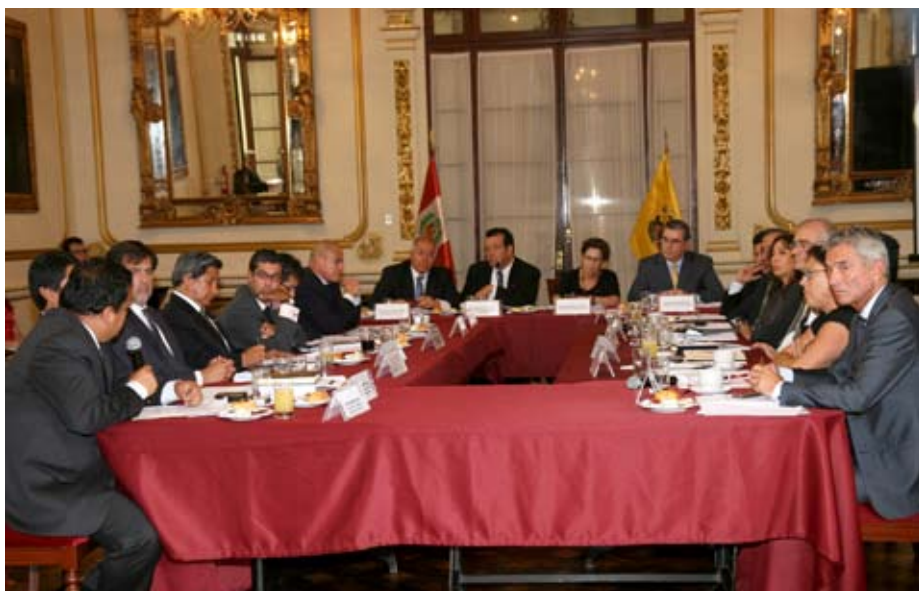
Reunión se realizó en la municipalidad de Lima.