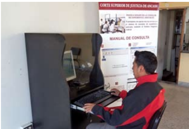
Los Módulos de Consulta de Expedientes Judiciales tienen el objetivo de descongestionar las Mesas de Partes y mejorar la atención al público usuario.

El Presidente de la Corte Superior de Justicia de Ancash, Dr. Abraham Vilchez Castro, inauguró dos módulos de consulta de expedientes judiciales en la puerta de la sede central del distrito judicial, los mismos que permitirán que los justiciables tengan acceso a sus expedientes de manera personalizada. La finalidad de la implementación de los Módulos Informativos con modernos equipos permitirán que los litigantes ya no tengan que hacer largas colas en la Central de Distribución General (Mesa de Partes), sino que ellos mismos puedan ingresar al sistema y verificar el estado actual de sus expedientes, es decir, si ya notificaron a las partes o emitieron sentencias, entre otros.