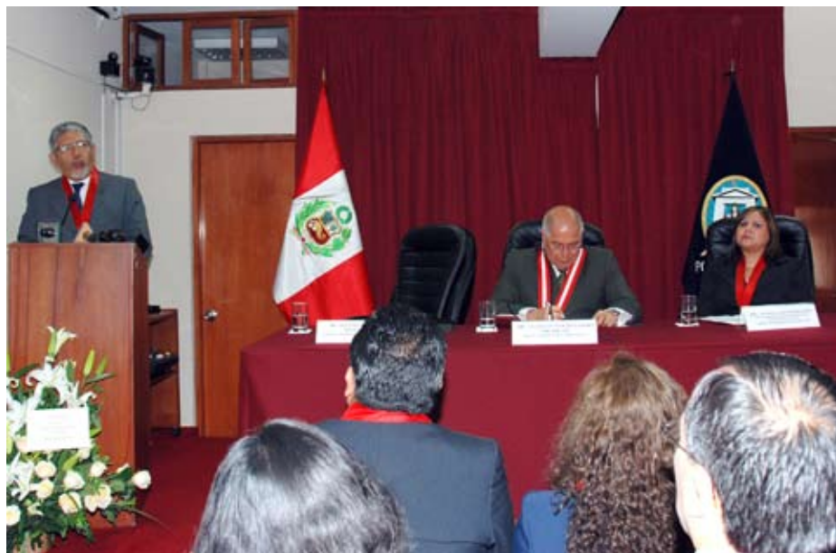
Con nuevo modelo procesal el número de quejas se redujo considerablemente.

● Doctor César San Martín observa que investigaciones preliminares no se traducen en acusaciones formales ante el Poder Judicial.