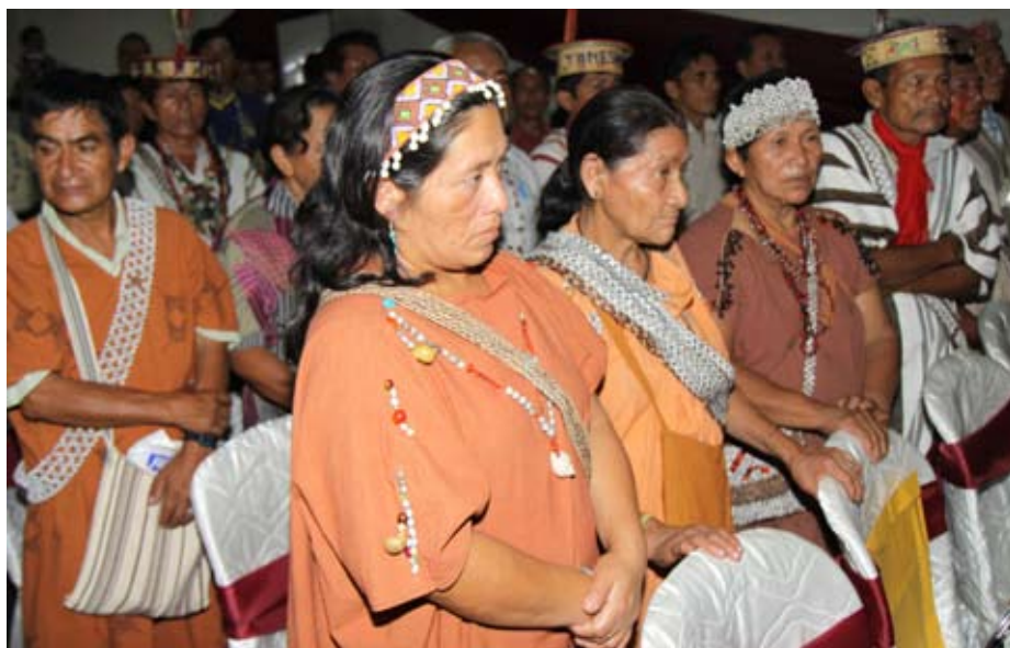
Reunión será en Lima en el mes de abril.